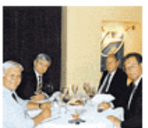
Die neuesten 500-Euro-Fotos der Leser-Reporter

Außerdem veröffentlichen wir täglich eine Auswahl der besten Fotos honorarfrei hier.