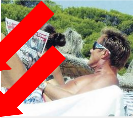
BILD-Leser-Reporterin Edyta Kwiatkowska (25) entdeckte Pop-Titan Dieter Bohlen mit BILD auf Mallorca

Hier können Sie auch direkt von Ihrem Computer das Bild hochladen und verschicken.