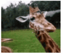
Die besten Tier-Fotos der Leser-Reporter

Viele Tausend Leser haben bereits mitgemacht und ihre schrägsten, verrücktesten und spektakulärsten Fotos geschickt. Wir sind begeistert!